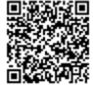
হাই স্কুল পরবর্তী জীবন