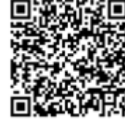
প্রিস্কুল ফ্যামিলি গাইড

যেসব প্রতিবন্ধিতায়ুক্ত শিক্ষার্থীর স্পেশাল এডুকেশন পরিষেবার প্রয়োজন আছে, তাদের ব্যক্তিগতকৃত শিক্ষা কর্মসূচি (ইন্ডিভিজুয়ালাইজড এডুকেশন প্রোগ্রাম, IEP) থাকে। স্পেশাল এডুকেশন প্রক্রিয়া সম্পর্কে বিস্তারিত তথ্য এবং সংস্থানের জন্য নিচের লিংকগুলো আপনাকে পথ-নির্দেশনা দেবে। আরও জানতে নিচের লিংকগুলো স্ক্যান করুন: