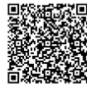
Специальное образование в Нью-Йорке